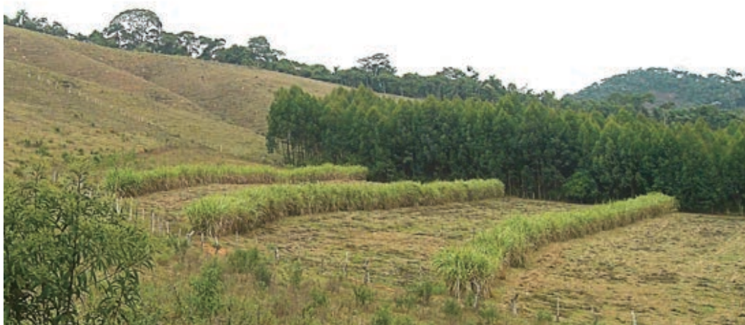
Figura 2 – Plantio de cana em faixas, reduzindo a velocidade da água da chuva do escoamento superficial. Brás Pires-MG. Julho de 2008.