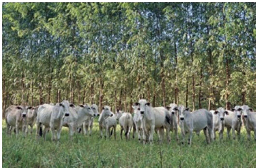
Figura 3 – Integração Lavoura, Pecuária e Floresta – Ipameri-GO.

A Embrapa, por ter centros diversificados e pesquisadores científicos em um grande número de áreas, foi responsável por dar início ao movimento, em ação conjunta com outras instituições do Sistema Nacional de Pesquisa Agropecuária (SNPA).