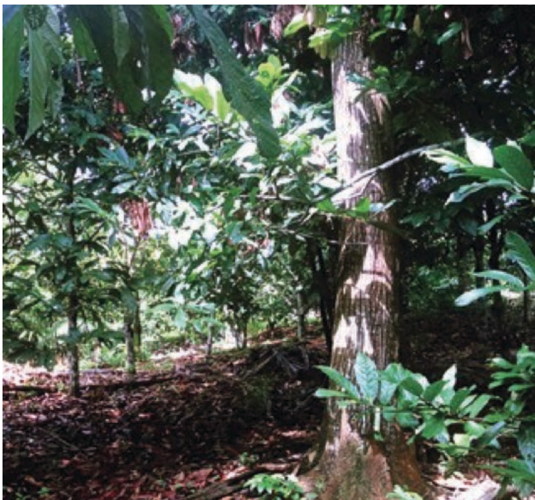
Figura 4 – Sistema agroflorestal