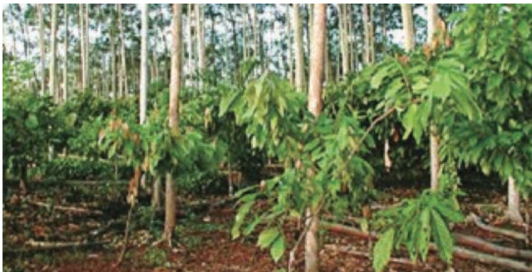
Figura 5 – Sistema agroflorestral com Paricá e cacau em Mirante da Serra – RO.