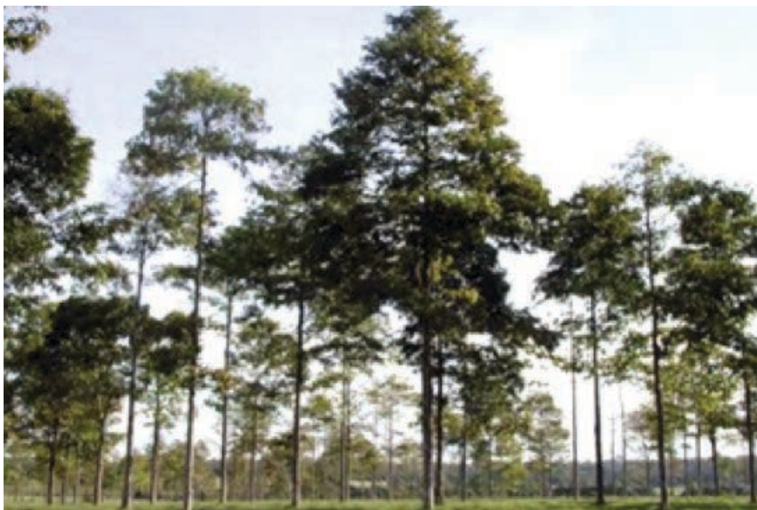
Figura 7 – Sistema Silvipastoril com castanha-do-brasil em Alta Floresta – MT.