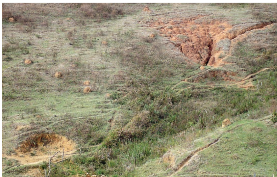
Figura 1 – Pastagem mal manejada apresentando erosões laminares, em sulcos e voçorocas. Município de Divinésia-MG. Julho de 2009.

A degradação do solo é um processo que pode ser provocado naturalmente (por condições de chuva, ventos, sol e incêndios naturais) ou pelas ações do ser humano, resultando na diminuição gradativa de sua capacidade produtiva em função da instalação de processos erosivos, da compactação, do empobrecimento químico e biológico, da acidificação e da salinização.