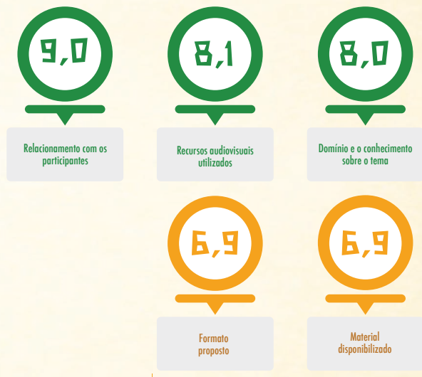
Aspectos que podem ser melhorados

Quanto ao curso, a análise das avaliações mostra que os alunos ficaram satisfeitos, onde os aspectos mais valorizados foram: