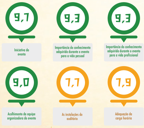
Aspectos que podem ser melhorados

A nota nos círculos indica a média das avaliações, sendo 10 a nota máxima. Em geral, os participantes ficaram satisfeitos com o seminário, valorizando, principalmente, os seguintes aspectos: